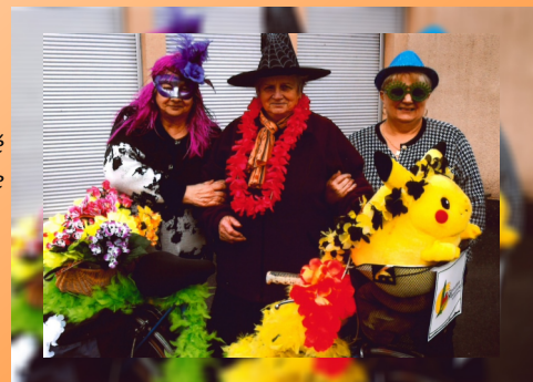
Le club a été représenté au Carnaval de l'école avec le vélo fleuri.