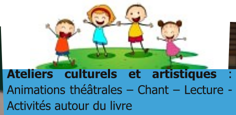
Ateliers culturels et artistiques : Animations théâtrales – Chant – Lecture – Activités autour du livre