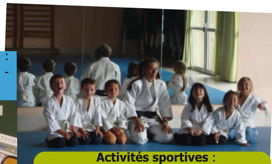
Activités sportives : Jeux d'opposition - Multi-sports/motricité