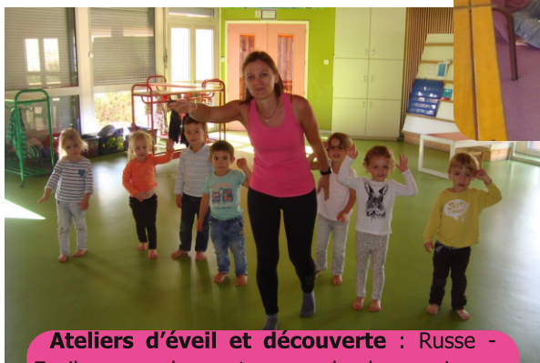
Ateliers d'éveil et découverte : Russe - Eveil corporel au travers de la musique - Relaxation/sophrologie - Protection de l'environnement