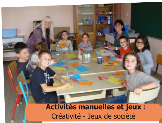
Activités manuelles et jeux : Créativité - Jeux de société