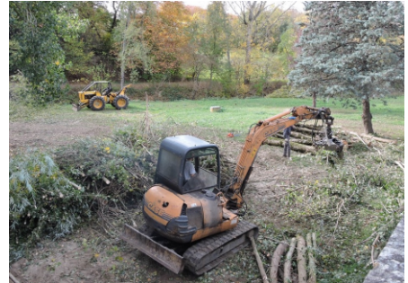
Nettoyage des berges du Sor (oct. 2015)

A la suite de l'opération de nettoyage des berges organisée par le CMJ en juin 2015, le Syndicat de la Vallée du Sor a procédé à des travaux d'entretien sur la rivière le Sor. Suite à ce nettoyage, la mairie de Soual met à disposition des habitants de la commune du bois de chauffage à partir du lundi 23 novembre. Si vous habitez Soual et que vous êtes intéressés par ce bois, vous pouvez venir vous inscrire au secrétariat de mairie. Vous devez disposer d'un moyen de coupe et de transport afin de pouvoir récupérer le bois par vos propres moyens.